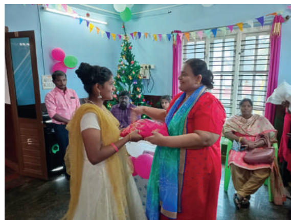
Remise des cadeaux.